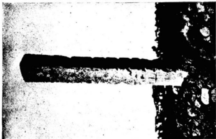
Pietrafitta Cupa in territorio di Sorrano, descritta al n. 16.