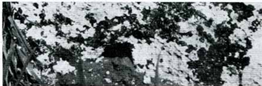
Particolare, buco artificiale situato a 25 cm. dal suolo, profondo cm. 12, largo cm. 10.