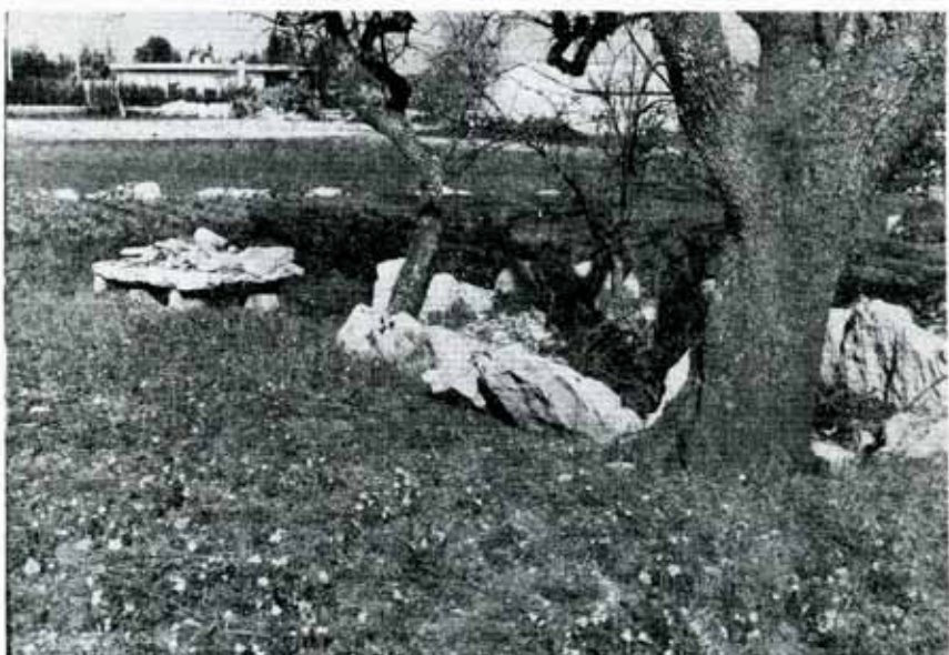
Tomba Megalitica e Dolmen (Maglie);