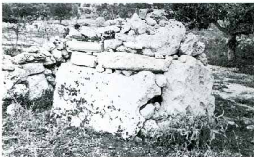
Dolmen Canali visto da S. (Maglie);

Nel 1977, esploravo i territori a N. ed W di Maglie. Individuavo vicino al Casato Bongiovanni, alle spalle del Campo Sportivo, in località S. Sidero, un primo monumento: